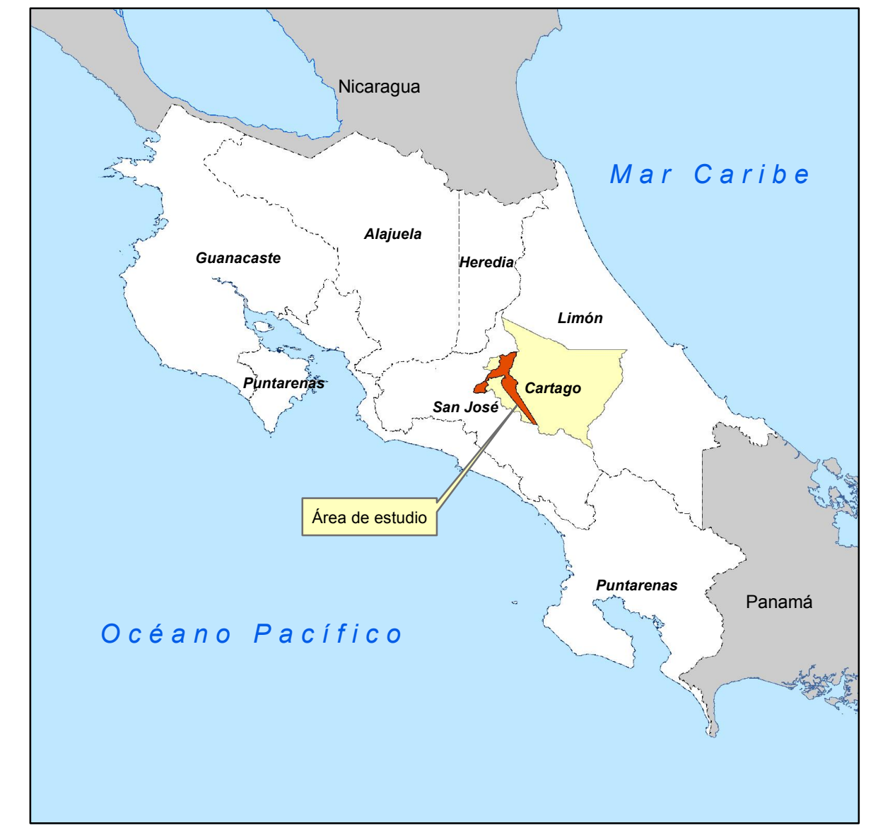
Diagrama de Ubicación